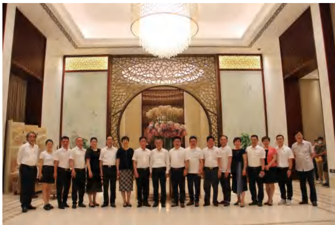
图为考察团与操龙灿市长合影

操龙灿对宁波市侨商会一行到蚌考察交流表示热烈欢迎。蚌埠是淮河生态经济带和皖北地区中心城市，拥有众多高新技术企业和良好的工业及城镇化基础，当前正紧抓长三角一体化发展。蚌埠与宁波结缘已久，今年又是甬蚌合作“十年之约”的开启之年，当前，蚌埠市以思想解放为先导，以产业合作为重点，以利益共享为基础，以机制建设为保障，深度推进甬蚌合作。希望双方以此次考察为契机，推动资源互补、优势叠加、同频共振、联动发展，唱响甬蚌“双城记”。