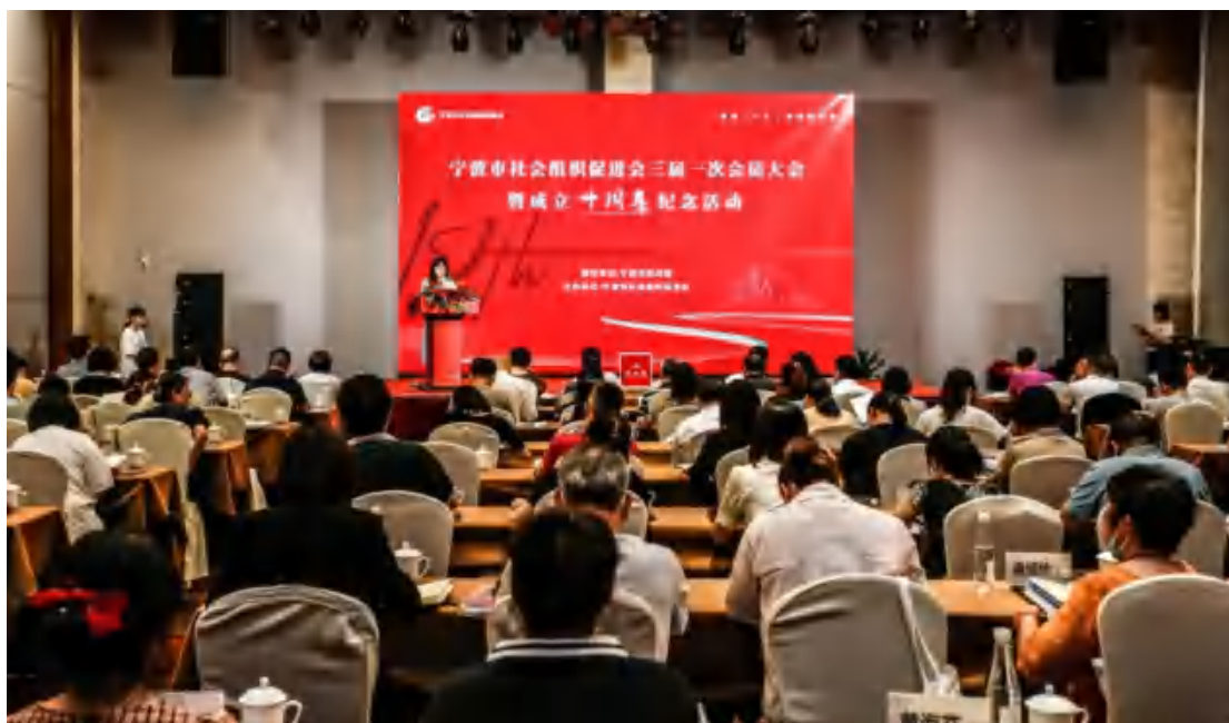
图为宁波市社会组织促进会三届一次会员大会

6 月 22 日，宁波市社会组织促进会三届一次会员大会暨成立十周年纪念活动在天港禧悦酒店召开。