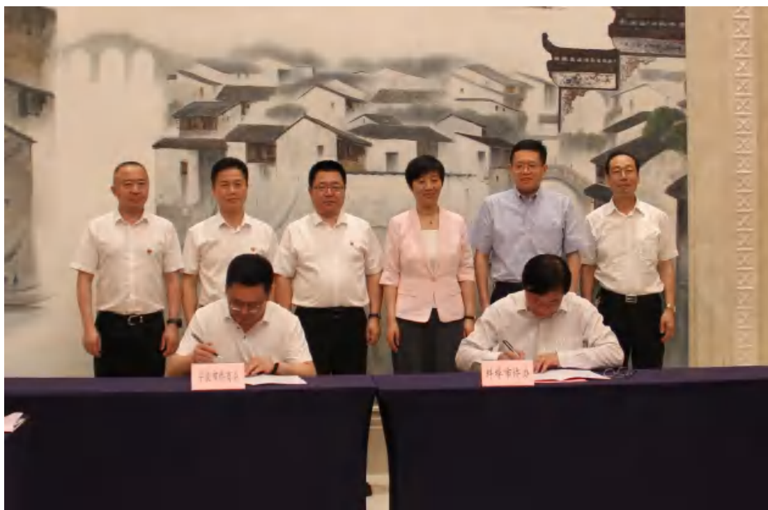
图为签订战略合作协议

随后，宁波市侨商会与蚌埠市侨办签订了战略合作协议，推动两地交流合作，互促共进，搭建项目平台，实现产业转移和承接，助力蚌埠市和宁波市侨商企业高质量发展。