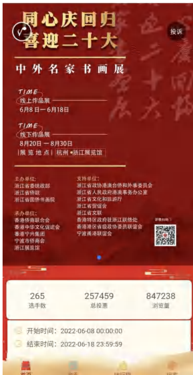
图为中外名家书画线上展投票及浏览量

据悉，此次书画展上线以来，平台浏览量突破了 84 万人次。根据线上展的投票情况和参展作品质量，结合中美协会会员和中书协会会员组成的专业评选委员会审定，综合选出优秀作品 100 幅，举行 100 名书画家线下展，将于 8 月底在浙江展览馆举行线下展。