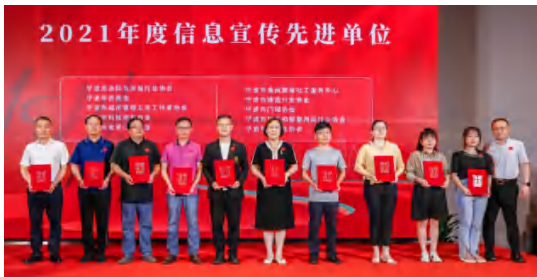
图为宁波市侨商会荣获“2021 年度信息宣传先进单位”