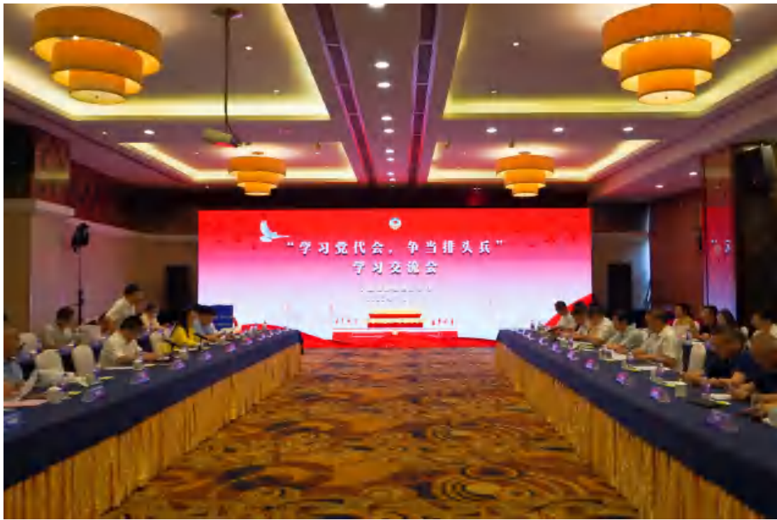
图为“学习党代会，争当排头兵”学习交流会

7 月 14 日，宁波侨商会政协委员会客厅“学习党代会，争当排头兵”学习交流会在宁波远洲大酒店举行。