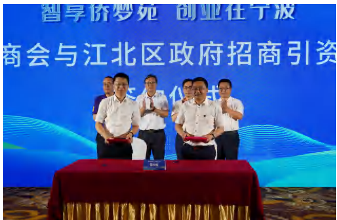
图为宁波市侨商会与江北区政府签订招商引资战略合作协议

大会还向大家展示了数字侨梦苑项目六大场景，包括侨梦苑全景展示、涉侨项目资源集聚、涉侨项目路演、涉侨项目“一键达”、涉侨全链条服务以及侨商云活动。