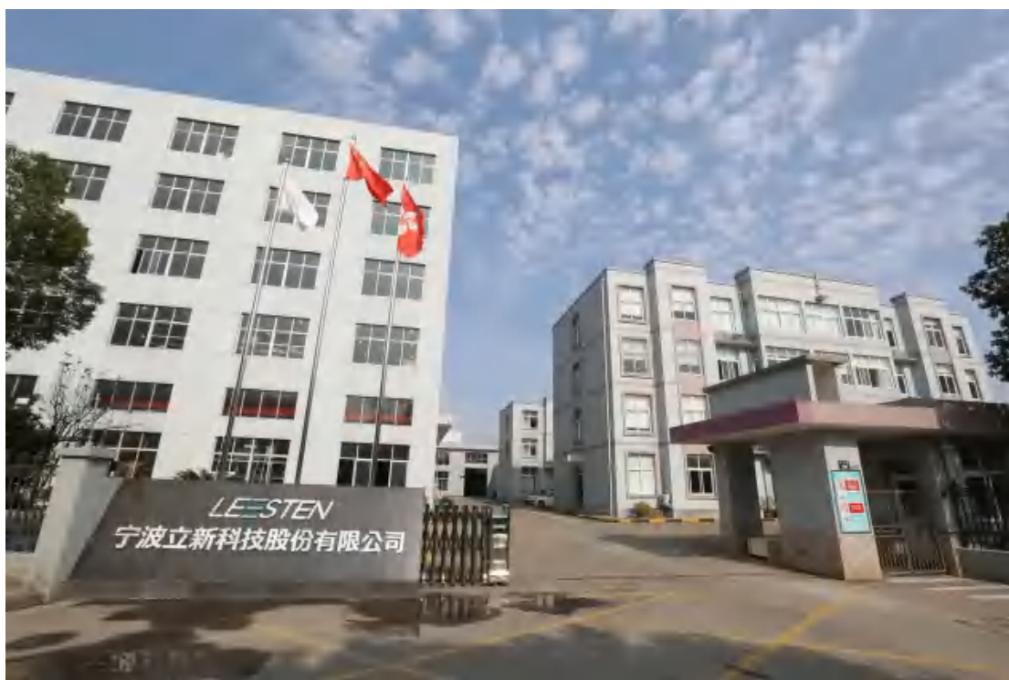
图为宁波立新科技股份有限公司

人，年生产能力可达 4 亿。主要从事高低压成套设备的设计、生产与销售，在全国各大城市分别设有销售与服务网点。公司的产品被广泛应用于电力、核电、数据中心、石化、大型广场、酒店、商业建筑、工厂、学校、医院、政府办公、别墅、社区等传统行业和“新基建”行业。